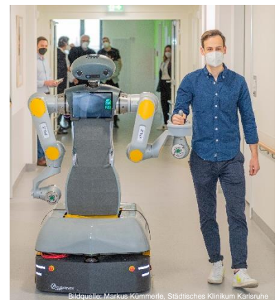
Führen und Stützen einer bewegungseingeschränkten Person durch einen Roboter

Physisch gekoppelte, kollaborative Mensch-Roboter-Systeme gehen bislang von einer für beide Akteure bekannten, gleichen Solltrajektorie für das gekoppelte System aus. Die Praxis zeigt jedoch, dass diese Annahme nicht gilt. Eine gemeinsame Trajektorie muss unter den beiden Akteuren daher erst ausgehandelt werden. Unklar ist bislang wie genau die haptische Kommunikation zur kooperativen Trajektorienfindung modelliert werden kann.